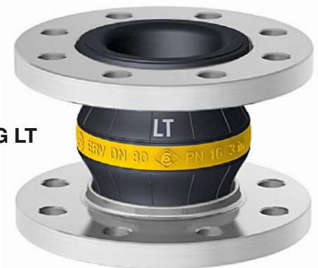
Type ERV-G LT

Innen : NBR (Nitril), nahtlos, abriebfest Druckträger : PA-Textilcord Außen : Chloropren CR Kennzeichnung : Gelber Ring mit weißem 'LT'-Aufdruck, ERV DN .., PN 16, Herstelldatum Flansche 1) : Drehbar, DIN PN 10/16, Stahl, verzinkt